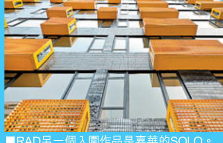
RAD另一個入圍作品是嘉華的SOLO。