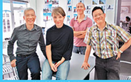
RAD得獎設計團隊合影。