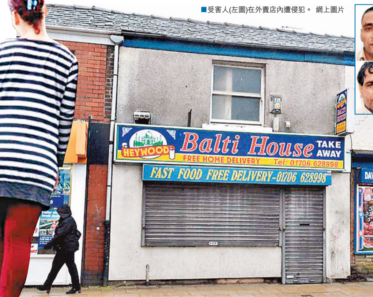
受害者(左圖)在外賣店內遭侵犯。 網上圖片

警方最終拘捕26名男子，9名年約22至59歲的被告前日被判罪成。他們被控多宗強姦、串謀利用未成年少女賣淫及販賣兒童作賣淫活動罪，是首次有人在英國境內販賣少女定罪。獨立警察投訴委員會(IPCC)正調查警方何以未有在4年前提訴，估計可能有更多受害人未有報案。 ■美聯社/《泰晤士報》/《每日郵報》