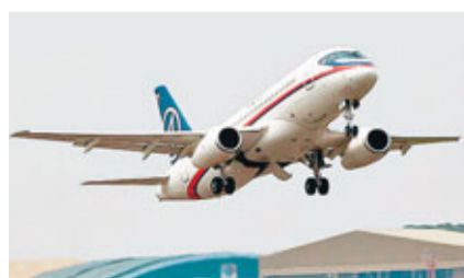
俄羅斯一架蘇霍伊超級100型客機(見圖)昨日在印尼作第2次示範飛行時，在雅加達南部山區失蹤。機上包括8名俄籍機組人員和多名記者在內，共50人生死未卜。印尼航空管理局指，可能因能見度低撞山，亦不排除飛機被劫持。

飛機於當日下午2時由雅加達哈林達達納庫蘇馬機場起飛，原定50分鐘後返回，但飛機突然由1萬呎急降至6,000呎。印尼運輸部發言人指，相信機師是主動急降，又指他當時正嘗試返回機場不果。飛機進入茂物空軍基地約10海里的山區時，在雷達上消失。 ■法新社/美聯社