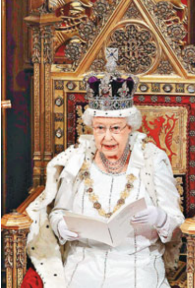
英女王親赴上議院，發表文詒。 路透社

英國上議院制度改革已談論多年，但一直未有落實。上議院雖無權立法，但有權對法案提出修訂，歷屆政府都不滿上議院阻礙法案通過，主張由委任制改為全面直選。 ■美聯社/法新社