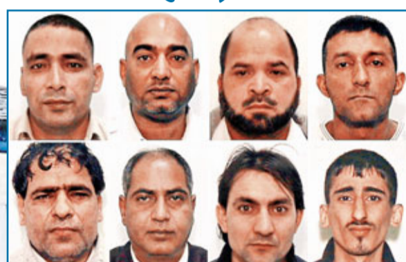
被判罪成的其中8名疑犯。 法新社