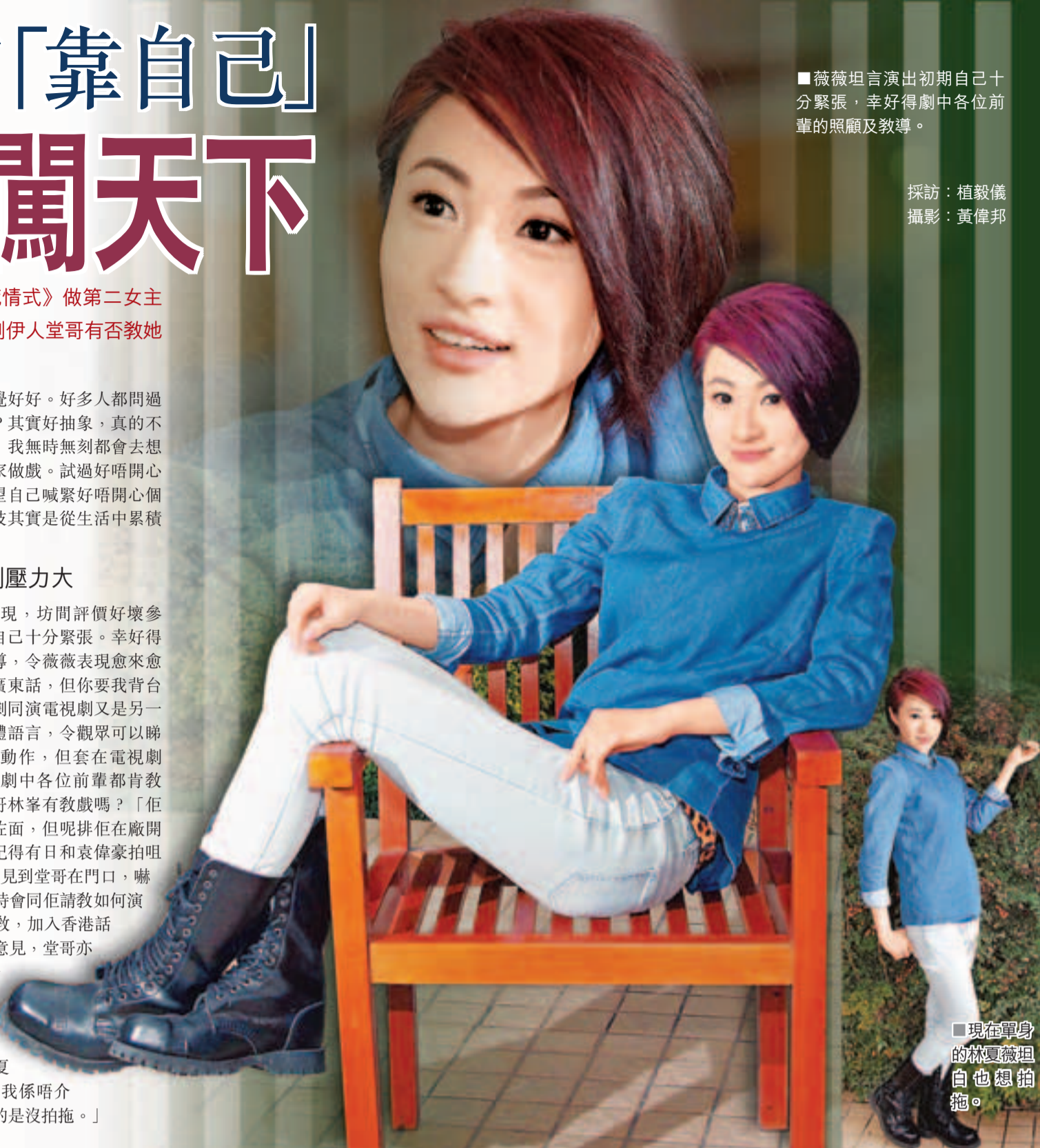
薇薇坦言演出初期自己十分緊張，幸好得劇中各位前輩的照顧及教導。