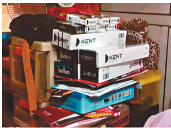
關員在被捕私煙買家居所搜出的未完稅香煙。

「魚雷」行動由上月中開始至本月初結束,行動中海關向法院申請搜查令,合共搜查全港22個多屬公屋的住宅單位,結果共拘捕22名相信是私煙買家的男女,檢獲1.1萬支私煙,以及一批宣傳單張。李遠文稱,檢獲的私煙目前仍未化驗成分,惟根據過