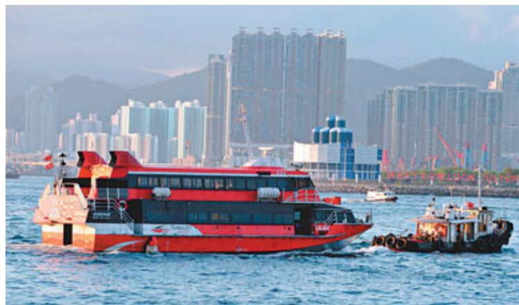
「帝皇星」號折返港澳碼頭後被拖返船廠檢驗。

香港文匯報訊(記者 劉友光、杜法祖)一艘載有142名乘客開往澳門的雙體高速噴射船,昨午天朗氣清下駛至大嶼山分流角對開珠海水域時,突與一艘內地登記的快艇相撞,快艇上1名疑是內地人男子墮海失蹤,事後港、珠當局聯手展開海空搜救,惜至入夜仍無發現。噴射船上無人受傷,惟須折返上環港澳碼頭接受當局調查,船公司安排乘客改搭另一艘噴射船繼續行程,但有部分乘客感到掃興退票離開,海事處正調查事故原因。