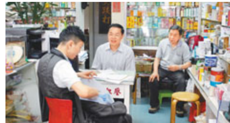
探員在遇竊藥房內調查。