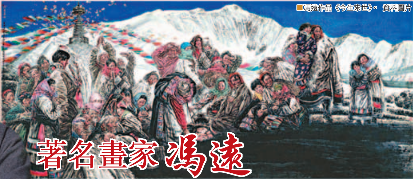
馮遠作品《今生來世》。