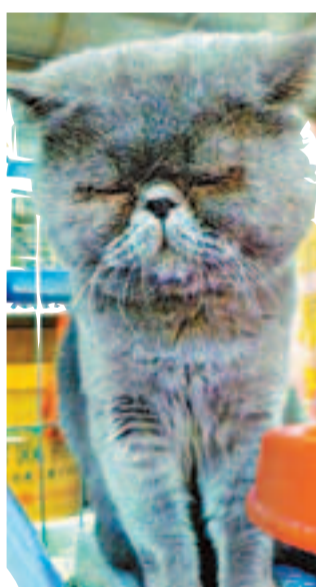
「傻乎乎」坐着就睡着了。