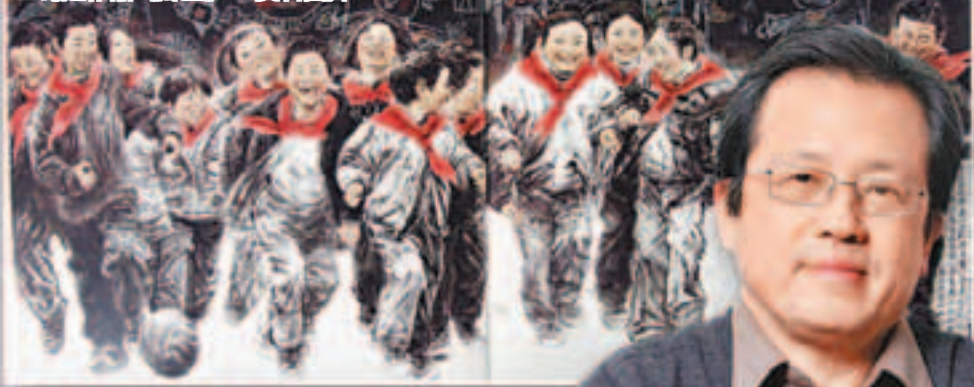
馮遠作品《鄉童》。資料圖片

展覽正廳的牆上，一群濃墨重彩的人物形象令許多人駐足凝視。蒼茫的雪山，遼闊的藍天，一張張飽經滄桑的面孔呈現了新時代西藏農民的典型形象。近日，中國美術家協會副主席、知名畫家馮遠的首次個人畫展在中國美術館舉辦。