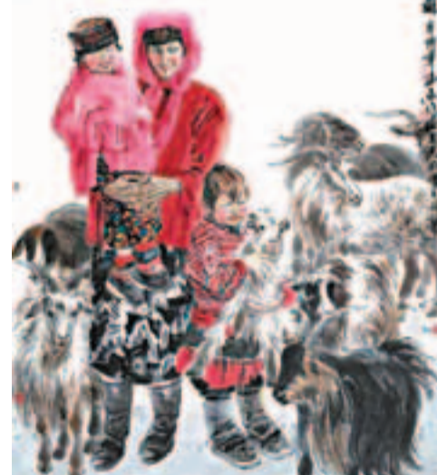
馮遠作品《母子圖》。

至於目前藝術市場在利益驅動力下的種種亂象，馮遠指出，有些藝術家追逐名利，粗製濫造，甚至搞流水線作業。而真正的藝術家應有理想，有擔當，創作有價值的作品引領藝術市場。同時，對於上述現象，政府應加強監管，收藏界應誠信經營。