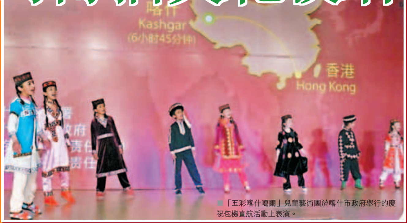
「五彩喀什噶爾」兒童藝術團於喀什市政府舉行的慶祝包機直航活動上表演。

喀什市借鑒「五彩傳說」的形式,讓兒童成傳播文化的使者,大力發揮促進喀什與各地、各國文化交流與合作。因此對「五彩喀什噶爾」兒童藝術團十分重視,希望將之打造成宣傳喀什的名片,所以他們特別為參與第四屆全國少數民族文藝匯演的人選舉行選拔賽,連喀什市委書記陳旭光也親身到場觀看,他認為在小孩身上可以看到一個民族的文化和民族的希望。據悉這次入圍的100名少數民族學生是從全市29所小學的從4萬餘名學生中層層選拔出來的。最後會選定50名左右的孩子加入「五彩喀什噶爾」兒童藝術團,小團員們將被統一安排集訓,到六月赴京演出。