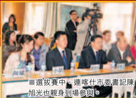
選拔賽中,連喀什市委書記陳旭光也親身到場參與。