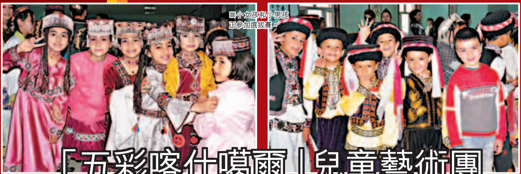
小女孩和小男孩正參加選拔賽。

香港文匯報訊(記者 焯羚)在4月下旬,中國「西部明珠」的喀什與「東方之珠」的香港實現首次包機直航,成功在空中架設一條「空中絲綢之路」,打開了與世界交融的窗口。喀什市政府特別舉行慶祝活動,活動上有一群非常漂亮、活潑可愛的小孩載歌載舞,吸引着來自東南亞及香港地區的投資商、駐港旅遊行業的嘉賓,原來他們是「五彩喀什噶爾」兒童藝術團,由王鈺喆(小喆導演)創辦,是「五彩傳說」民族文化工程之一。兒童藝術團的「五彩帕米爾」塔吉克兒童合唱團,在去年7月香港國際童聲合唱節上獲得金獎。6月6日將在北京參加第四屆全國少數民族文藝匯演盛典,是新疆維吾爾自治區唯一獲邀的團體。