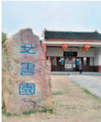
建在浦尾女書村的女書園，保存有珍貴的女書文獻資料。

據江永縣宣傳部門的人士介紹，這種情形源於女書的一個傳統——「人死書焚」。為了讓死去的姐妹不寂寞，能繼續享受陽間結伴、互通女書的情緒，死者的家屬和結伴姐妹會把她保存的女書全部放進棺材陪葬，或者在靈前全部焚燬。