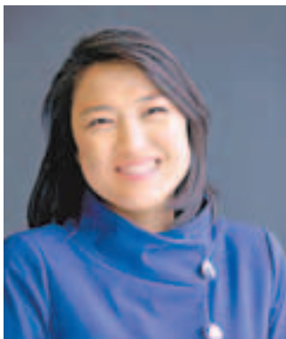
張欣相信,SOHO中國銷售額將隨內地信貸放鬆而回升。

SOHO中國早前斥資21.37億元購入綠城中國(3900)持有70%股權的上海天山路項目,董事長潘石屹今年初曾表示,今年預留100億元作併購。