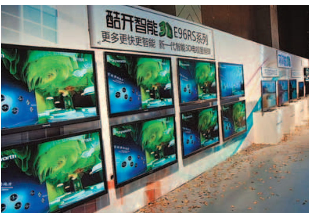
據估計,內地3D電視今年市場份額達800億元,各大彩電企業均推出新產品應戰。

為了把握智能3D機遇, TCL剛在4月中旬發佈了以V7500、E5390為新品的6大系列3D智能雲電視,形成了目前業內最強大的3D智能雲電視產品陣營,還在業界率先實現現在3D、LED產品上的智能雲技術全覆蓋。TCL有關負責人告訴記者,在價格方面, TCL針對目前市場上雲電視價格普遍高企的行業現狀,通過技術創新、成本優化、調整價格策略,率先把3D智能雲電視的價格調整到普通3D電視的價位,讓消費者以一台普通3D電視的價錢就能夠享受到領先的3D智能雲生活,推動3D電視實現全民普及。