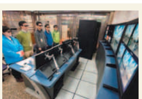
央視3D頻道早前開播,將轉播今夏倫敦奧運會等活動。圖為央視工作人員在播控機房對3D頻道進行監控。

果的問題,會出現影像模糊和重影等,同時它可能會帶來更嚴重的視覺暈眩感,技術有待改善和成熟。