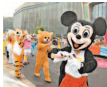
本屆動漫節共有208萬人次參觀,圖為卡通人物巡遊。