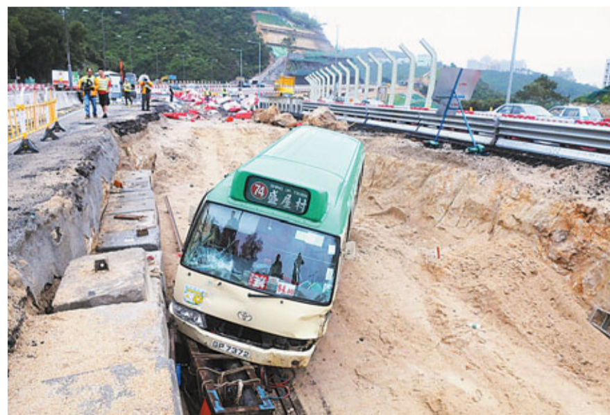
載滿客的專線小巴剷落地盤大坑。

小巴上各人東西西倒，其中5男1女乘客手腳和頭部撞傷，小巴姓關(54歲)司機和其餘乘客沒有受傷，飽受虛驚，事後自行落車。而肇禍的士則衝前10多米始停下，車頭損毀，姓徐(44歲)司機和男乘客同告受傷。警方及救護人員接報到場，將2車共8名男女傷者送往屯門醫院治理。