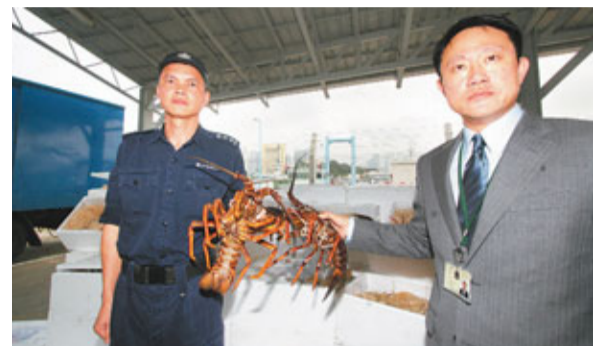
水警與海關聯手檢獲一批走私龍蝦。