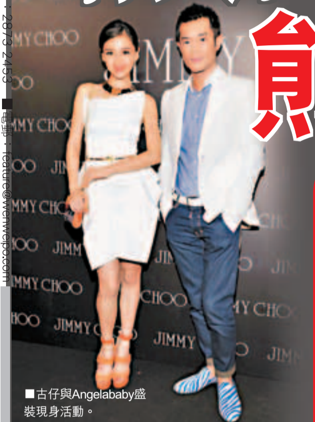
古仔與Angelababy盛裝現身活動。