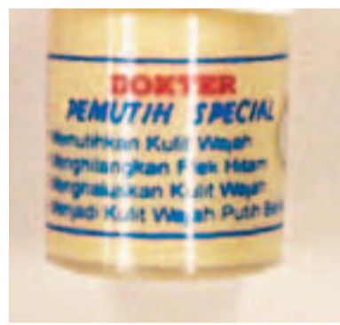
衛生署呼籲市民不要購買或使用一種名為「DOKTER PEMUTIH SPECIAL」的美顏霜，因為該產品可能含過量水銀，危害健康。

香港文匯報訊(記者 文森)一種名為「DOKTER PEMUTIH SPECIAL」的美顏霜可能含過量水銀成份，使用後可能危害健康。一名29歲女病人從印尼購買該產品回港，持續使用3個月後出現水銀中毒症狀，治療後已出院。化驗結果顯示，產品樣本的水銀含量為可接受水平的1.22萬倍。衛生署呼籲，正使用該產品的市民，應立即停止使用。