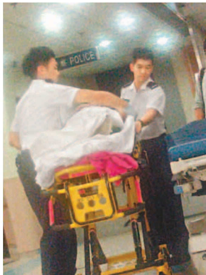
一名內地孕婦早前衝關由救護車送入屯門醫院急症室。