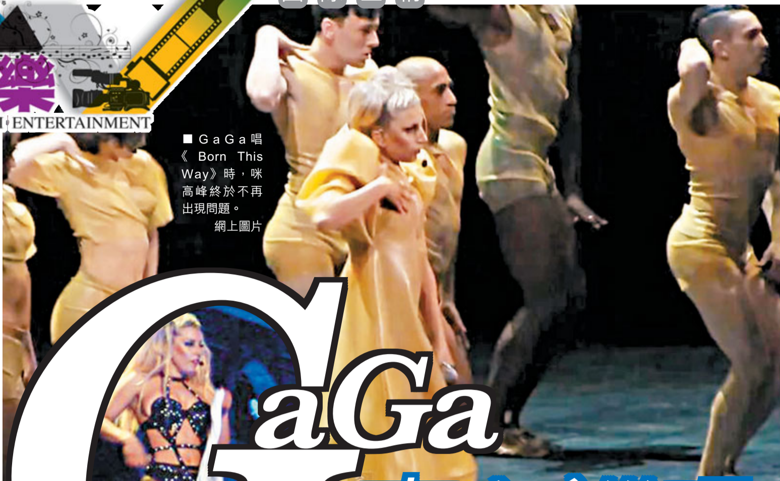
■ GaGa唱《Born This Way》時，咪高峰終於不再出現問題。