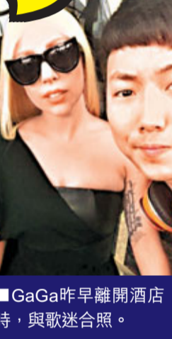
■GaGa昨早離開酒店時，與歌迷合照。