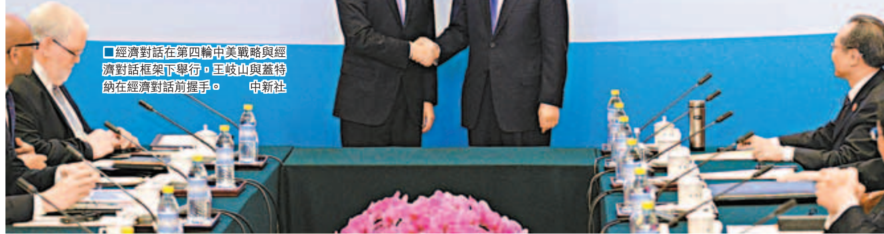
■經濟對話在第四輪中美戰略與經濟對話框架下舉行。王岐山與蓋特納在經濟對話前握手。

香港文匯報訊（記者 葛沖 北京報導）「當前全球經濟復甦乏力，形勢依然嚴峻複雜，『家家有本難唱的經』，歐債危機不斷反覆，新型經濟體增速放緩，大宗商品價格大幅波動，在此形勢下，中美首先要把自己的事辦好。」在昨日中美戰略與經濟對話開幕上，國務院副總理王岐山如是說。他同時呼籲，美方切實放開對華高科技產品出口管制，擴大金融市場的准入，避免經濟問題政治化。美國財政部長蓋特納則在隨後對話會上承諾，美國不久後將採取行動放寬對華高科技產品出口限制。