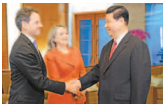
■習近平在釣魚台國賓館會見希拉里和蓋特納。

蓋特納表示，美方希望同中方加強協調與合作，共同促進兩國經貿關係發展，推動全球經濟復甦。