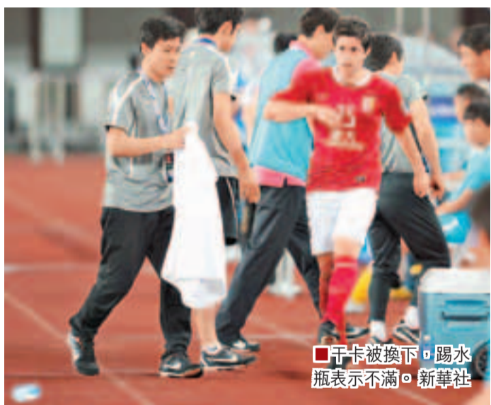
干卡被換下，踢水瓶表示不滿。

在福建泉州的訓練基地進行了18天的集訓之後，從4月21日開始到5月6日，中國女排要輾轉福建與浙江的7個城市，分別與日本女排以及韓國女排進行7場對抗賽，跨度之大，時間之長，這對隊伍來說是前所未有的。中國女排主教練俞覺敏表示，這次集訓有兩個目的：檢驗集訓成果和尋找比賽感覺。