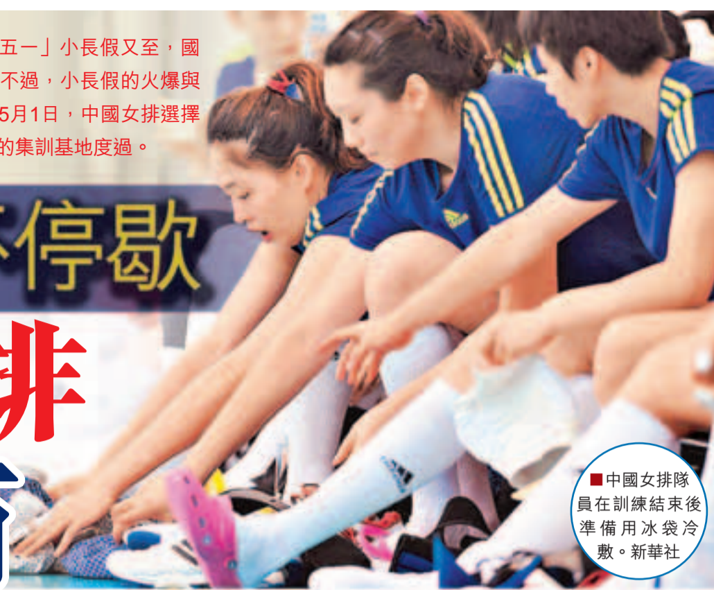
中國女排隊員在訓練結束後準備用冰袋冷敷。