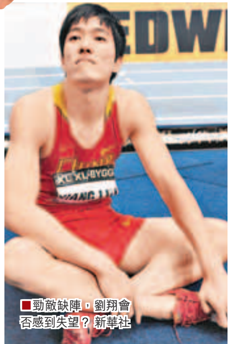
勁敵缺陣，劉翔會否感到失望？新華社

從各選手的個人最好成績以及去年最好成績來看，劉翔的實力遠超其他選手，分別是12秒88和13秒00。史冬鵬的個人最好成績13秒19排在第2，美國選手歐默在去年創造的13秒23的個人最佳也具備一定的競爭力。日本四將中成績最好的是34歲的老將田中野輔，曾經跑出過13秒55，但這成績還遠不到13秒52的奧運A標。如此看來，劉翔奪冠的把握很大，關鍵在於檢驗訓練成果和適應室外比賽節奏。