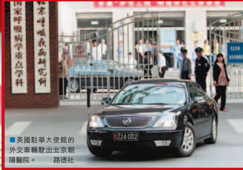
■美國駐華大使館的外交車輛駛出北京朝陽醫院。