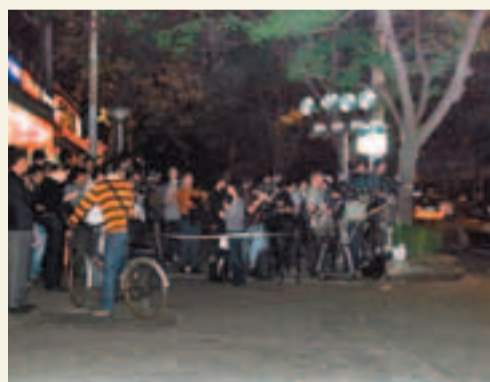
■朝陽醫院對面馬路拉起警戒線，數十記者在線外遙望院門，隔路守候。