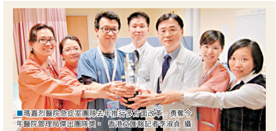
■瑪嘉烈醫院急症室團隊去年推行多方面改革，勇奪今年醫院管理局傑出團隊獎。

司法機構發言人承認，強拍個案增加，難免對土地審裁處人手資源造成壓力，已作出臨時安排，在去年從區域法院暫時調配一位暫委法官負責審理案件，未來這些調配都會常規化，又會開設新職位增加人手。