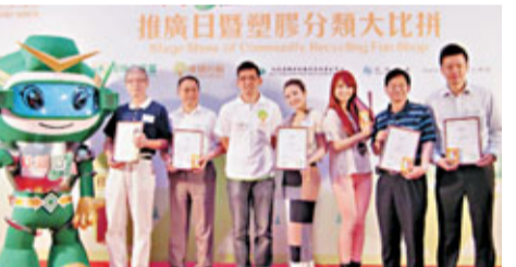
■環保署資助綠領行動100萬推「社區回收有Fun店」計劃。