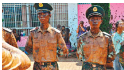
廣場周圍保護秩序的警察也變成「泥人」。

每年五月初，一年一度的東方狂歡節佤族「摸你黑」在雲南臨滄邊境的滄源縣拉開戰幕。狂歡開始之前，人們「全副武裝」，耳朵裡也塞上保鮮膜。等佤族姑娘的「甩髮舞」結束就宣佈狂歡開始，人們不停地從缸裡抓起藥泥，就連廣場周圍保護秩序的警察也難逃「黑」。