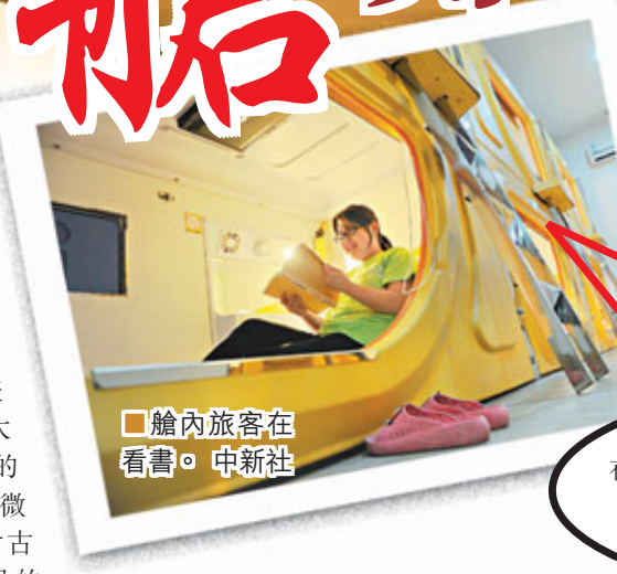
艙內旅客在看書。

陝西師大心理學教師李瑛稱，隨着內地自駕遊、背包客的流行，旅館業正進入「微型化」時代，微型旅館以溫馨、便捷及經濟等特點引起年輕人的共鳴，同時也成為時尚一族追求休閒生活的直觀體現。