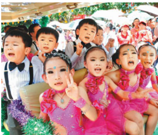
雲南曲靖市的四胞胎「四小龍」演唱組合（後）和他們的伴舞「四小鳳」一起參加大巡遊。

唱着動聽的歌曲，跳着歡快的舞蹈，來自海內外的上千對雙胞胎1日在「雙子之城」雲南省墨江哈尼族自治縣歡聚一堂，展示才藝，共慶第八屆中國墨江北回歸線國際雙胞胎節暨哈尼太陽節。