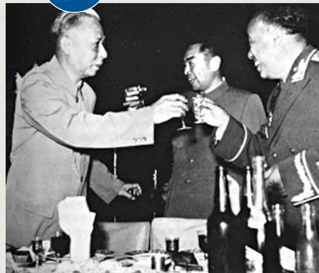
劉少奇向朱德敬酒。