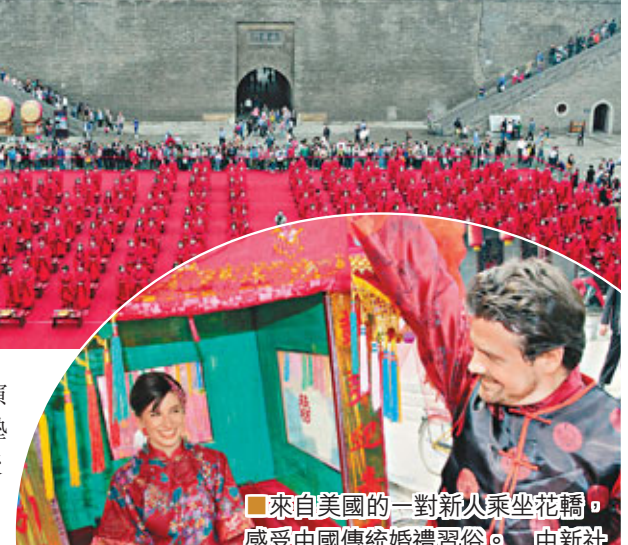
來自美國的一對新人乘坐花轎，感受中國傳統婚禮習俗。