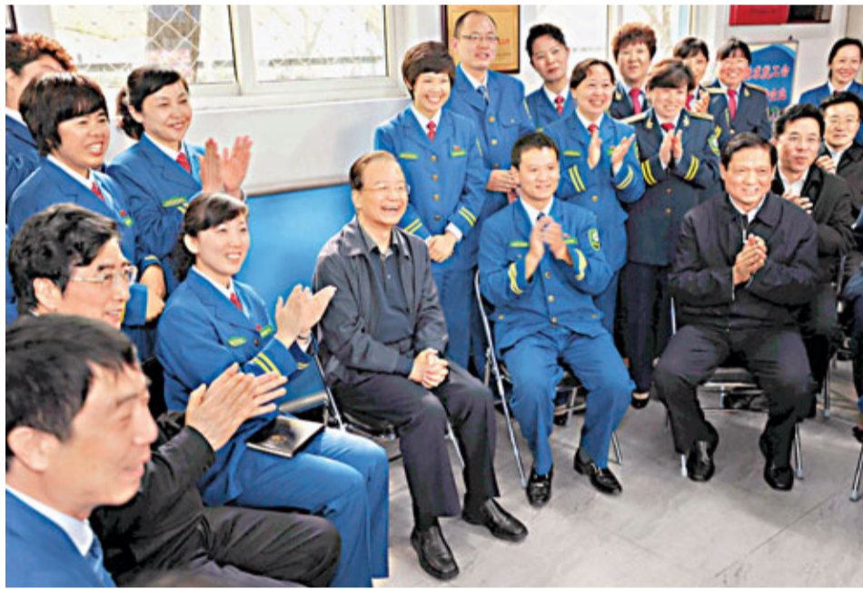
5月1日，溫家寶總理看望北京市公交職工時，和職工們交談。

溫家寶說，環衛工人不嫌髒、不怕累，而且以此為榮，不容易，不像是有人挑剔工作。而是父親幹一輩子，孩子還幹一輩子，丈夫幹，妻子也幹。他們有個觀念，把幹這項工作作為光榮，知道這項工作北京離不開、人民離不開。