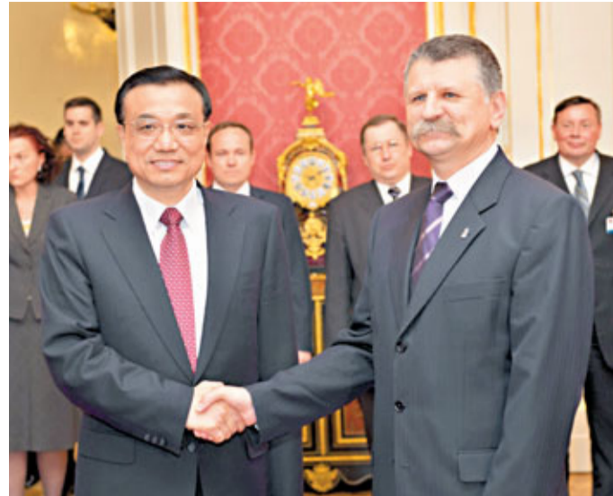
4月30日，國務院副總理李克強在布達佩斯會見匈牙利代總統克韋爾。

李克強當日還參觀了布達佩斯中雙語學校。李克強先後訪問了俄羅斯和匈牙利，未來幾天，還將訪問比利時和歐盟總部。