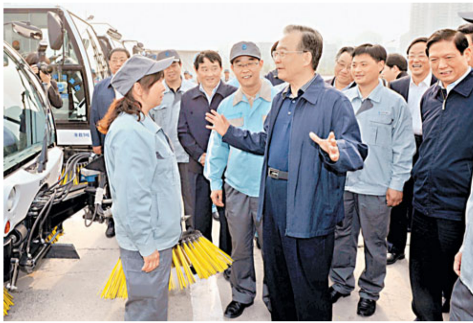
5月1日，溫家寶總理前往看望北京市環衛工人，和他們共度「五一」勞動節。

公交集團下屬的西直門橋南公交場站，看望公交職工，登上純電動汽車和雙源無軌電車，仔細了解新能源汽車的性能和運行情況。