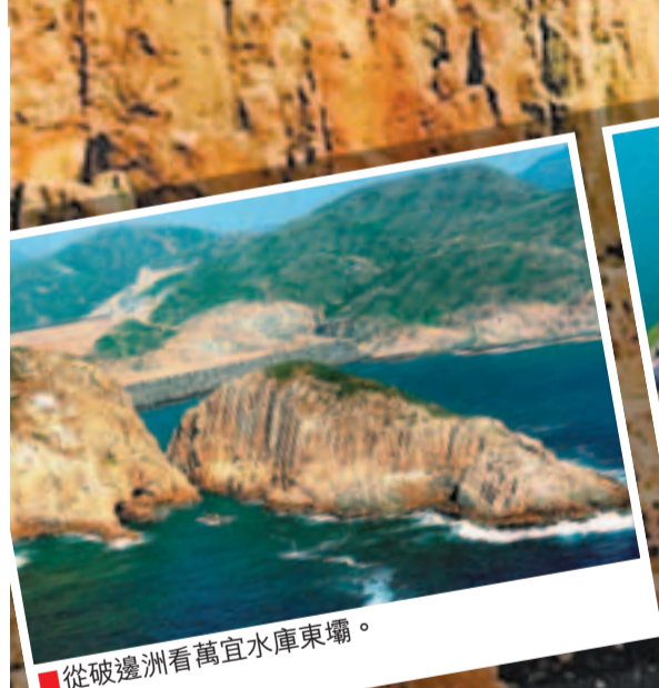
■從破邊洲看萬宜水庫東壩。

隨後返回平坦山坳，往西南，即花山山腰處上走。到達後繞着花山南麓小徑行走，視野廣闊。近白臘村時留意灘盡處有繩索供下落沙灘。於灘後近中央處的隱蔽小路而入，不久即可踏上鮮有人走的水泥路。左走(右走應可回萬宜路，時間情況不詳)便可到白臘村，後再右水泥路即可到萬宜路。