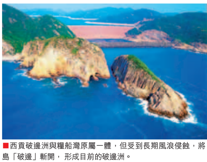
■西貢破邊洲與糧船灣原屬一體，但受到長期風浪侵蝕，將島「破邊」斬開，形成目前的破邊洲。

破邊洲是香港一個島嶼，位於西貢區萬宜水庫東壩對出，以六角石柱的奇觀而聞名。這裡原是由糧船灣花山伸延入海的一個海岬，但因長年受海浪侵蝕，結果與花山分離成為海蝕柱。1億多年前的侏羅紀時期，香港發生多次火山爆發，噴出大量熔岩及火山灰。噴至火山口邊的火山灰冷卻後，該處成為切面是六邊形的石柱。破邊洲整體結構長約200米，闊約100米，高約63米。