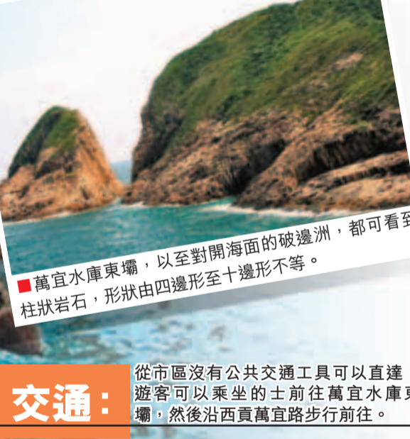
■萬宜水庫東壩，以對開海面的破邊洲，都可看到柱狀岩石，形狀由四邊形至十邊形不等。