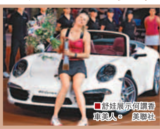
■舒娃展示何謂香車美人。

「泥地王」拿度又破紀錄，這名男網世界排名第2的球手周日在巴塞羅那公開賽決賽，以總盤數2:0力挫西班牙同胞費拿，第7次高舉賽事冠軍獎盃，連同早前在蒙地卡羅大師賽成就3連霸偉業，拿度成為史上首名在2項賽事中各贏得7次冠軍以上的球手。拿度上周在蒙地卡羅大師賽決賽力挫世界第一哥祖高域，完成8連霸，相隔一週後，拿度以7:6和7:5的盤數擊敗費拿，第7次在巴塞羅那公開賽加冕，取得前無古人的成就。拿度賽後高興地說：「我贏下2項極難應付的賽事，在蒙地卡羅賽和巴塞羅那賽不失一盤冠軍。沒有人比費拿更值得在這裡奪標，但我今日是有點幸運。(我需要真正享