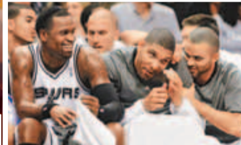
■馬刺穩操勝券，(左起)史提芬積遜、鄧肯和柏加輕鬆說笑。