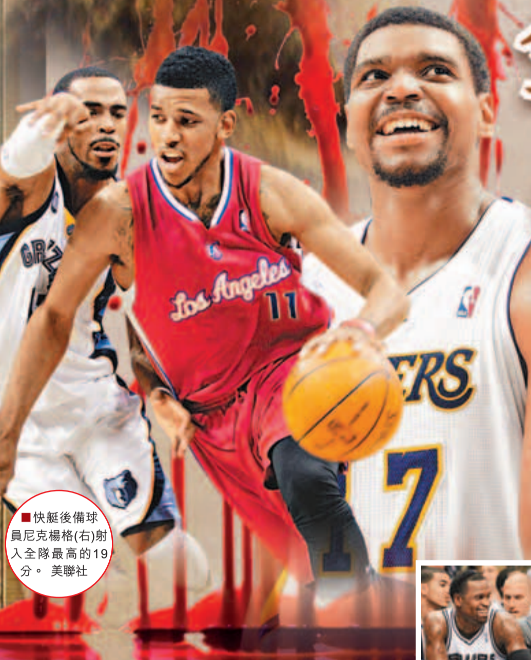
■快艇後備球員尼克楊格(右)射入全隊最高的19分。