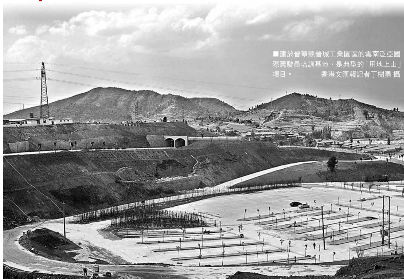
■建於晉寧縣晉城工業園區的雲南泛亞國際駕駛員培訓基地，是典型的「用地上山」項目。