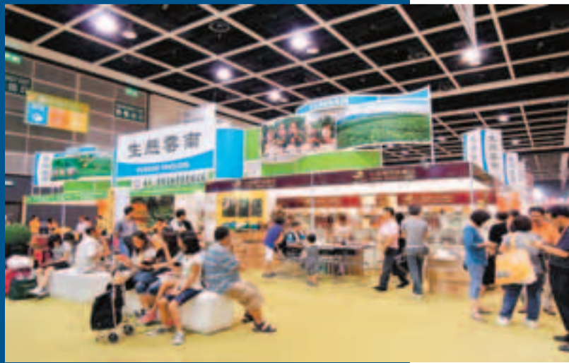
■雲南蔬菜，港人至愛；雲南普洱，香港熱銷。

隨着雲南加快中國面向西南開放重要橋頭堡的建設步伐，中國—東盟自由貿易區、GMS和泛珠3個區域內各方的合作相互依存度日益緊密，也進一步拓展了滇港合作的潛力空間；泛珠區域合作為雲南香港兩地的合作提供了一個更高的制度性平台；《內地與香港關於建立更緊密經貿合作安排》的簽署實施，使滇港合作具有更可靠的政策支持，為滇港兩地加強經貿往來創造了更優厚的條件，為滇港合作開拓了新的境界。如今，港資流向正逐步突破原有領域，更趨多樣性地與雲南的優勢產業結合起來。