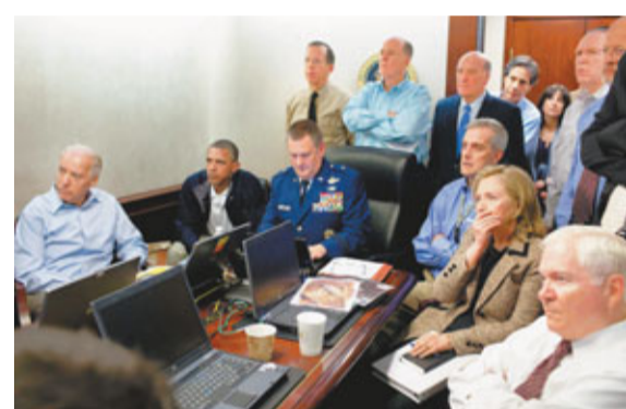
殺拉登當晚，海豹特擊隊直升機墜毀(下圖)，嚇得希拉里掩嘴。