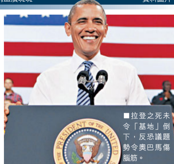
拉登之死未令「基地」倒下，反恐議題勢令奧巴馬傷腦筋。

美方新戰略將是「小規模、聰明且隱隱地反恐」，避免高調入侵他國領土，以免弄巧反拙，令更多人投身恐怖組織。美國相信，扎瓦希里目前正藏匿在巴基斯坦山區，但因美方去年緝捕拉登時擅自行動，之後又在巴國邊境誤殺巴兵，兩國關係僵持不下。巴國拒