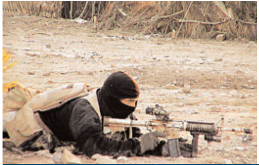
美國海豹特擊隊去年5月2日在奧巴馬下令下，在巴國大宅擊殺拉登，其後片段可見拉登睡房內血漬斑斑。