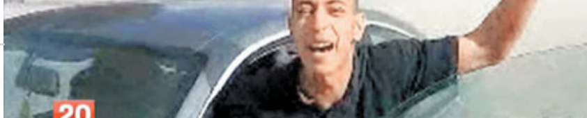
圖盧茲槍擊案中的法籍穆斯林槍手梅拉赫便是「獨狼」。資料圖片