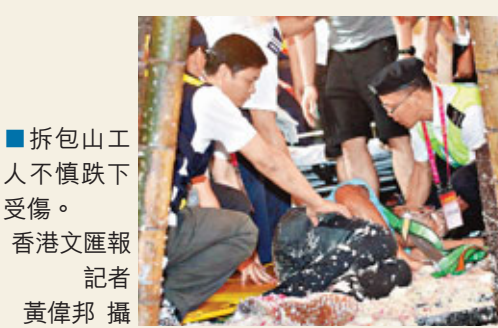
■ 拆包山工人不慎跌下受傷。

去年大受歡迎的「激光模擬對抗射擊」今年繼續舉辦,市民在「模擬訓練體驗區」中,手持95式自動步槍,以激光向假人標靶射擊,若命中目標,假人標靶會冒出彩煙。射擊體驗尚未開始,已吸引逾百名市民排隊,摩拳擦掌,想盡快過「槍癮」。