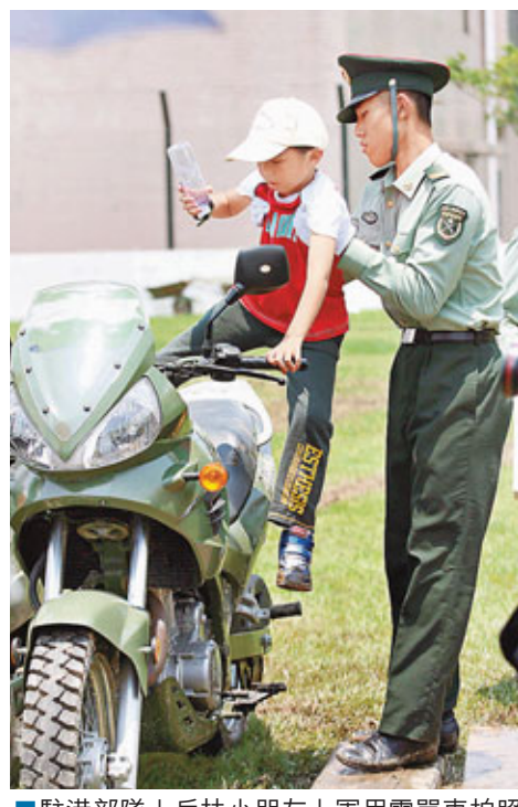
■ 駐港部隊士兵扶小朋友上軍用電單車拍照留念,盡顯鐵漢柔情。