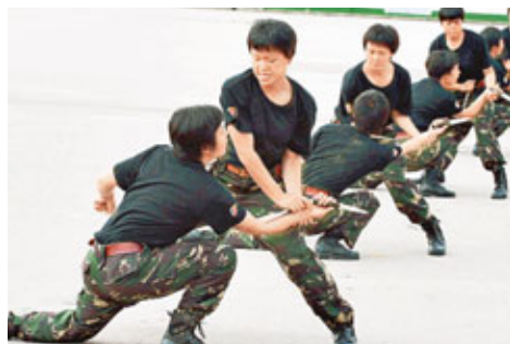
■ 新圍駐軍女子特種兵在演練場上表演拳術,贏得參觀市民陣陣掌聲。