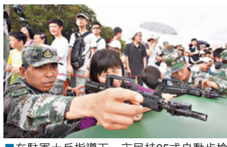
■ 在駐軍士兵指導下,市民持95式自動步槍以激光向假人標靶射擊。