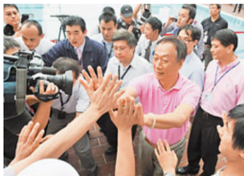
郭台銘與大陸員工打成一片。

據稱，深圳龍華富士康廠區將成為「鴻海帝國」的「示範單位」。媒體稱，鴻海將在5月1日後在深圳覓址設立醫院，並引進台大醫療團隊；未來也將在當地開辦「鴻海學校」，向員工子女提供包括小學、初中、甚至專科以上的教育，而為配合鴻海的跨國業務，學校更會