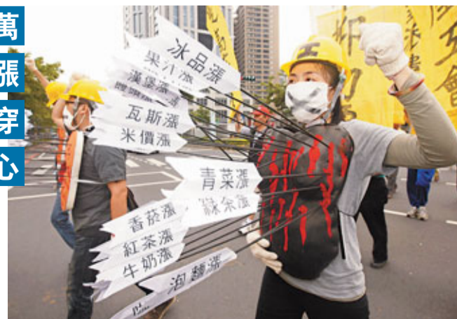
島內多個勞工團體29日號召了上千人，在新北市發起一大遊行，強調「反貧窮要生存」訴求，凸顯油電將雙漲下，勞工生存不易的困境。他們除了高喊口號，現場還演出勞工被綁漲的油價、電費、學費萬箭穿心的行動劇，希望政府能聽到基層勞工的訴求。還有手持掃帚、廚餘桶、資源回收物的臨時清潔隊員，要求轉為正職人員、同工同酬。

香港文匯報訊 「十二年基本教育」話題不斷，市場上也開始出現不少家長，期待藉由「購屋」讓孩子入讀「明星高中」的可能。台灣傳媒報道，有房屋中介業者統計了台北、台中與高雄三大都會區，第一志願學校附近最近5年的房價後發現，台北市的「北一女」漲幅超過六成五，「建中」也增加五成以上，甚至高過台北市平均漲幅的42.7%；然而「台中女中」卻由於位於屬「舊社區」的中區，發展比較不容易，房價有點「漲不動」只維持「平盤」。