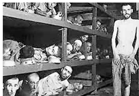
奧斯維辛集中營悲慘一角。 網上圖片

奧斯維辛集中營 (Auschwitz Concentration Camp) 是德國納粹在第二次世界大戰期間修建的1000多座集中營中最大的一座。由於有上百萬人在這裡被德國法西斯殺害，它又被稱為「死亡工廠」。該集中營距波蘭首都華沙300多公里，是波蘭西南部奧斯維辛市附近40多座集中營的總稱。