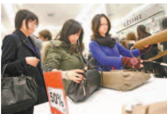
華人顧客頗受倫敦商家歡迎。圖為華人顧客在倫敦大百貨店掃貨。

在今夏全球目光聚焦倫敦奧運會之際，會有更多的中國公民前往英國。為應對日益增長的簽證需求，英國政府推出了一系列新的簽證舉措。除了新的在線申請系統外，新的「5天簽證」的特殊服務政策，也於4月16日在北京、上海、廣州、南京、杭州和深圳這6個城市的英國簽證中心推出。賀斯民透露，對於曾經到訪過英聯邦國家的商務簽證申請者，只需每人額外繳納520元人民幣，就可保證在5個工作日內拿到簽證，且無需預約。