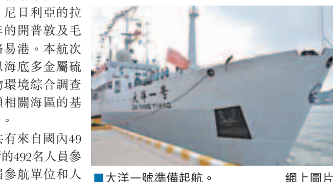
大洋一號準備起航。

員最多的一次。此外，本航次時間跨度長、任務重，目標多，使用、試用和實驗高新技術設備。將使用具有自主權的無人攪控潛水器 (ROV) 開展高精度海底觀測與取樣；使用聲學深拖開展高精度海底地形調查；試用拖曳式資源綜合探測系統開展資源調查；在西南印度洋布放天然地震儀。