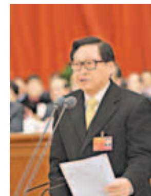
全國人大常委會副委員長華建敏。

華建敏對前海開發提出3個期望，一是探索粵港合作新途徑；二是探索符合中國國情的發展現代服務業新路，希望前海在現代服務業和先進製造業如何雙輪並進這方面做出探索；三是探索如何