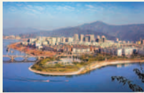
開縣漢豐湖景區鳥瞰。

香港文匯報訊(記者 楊毅 重慶報道) 揚州有「瘦西湖」，重慶開縣則着力打造「胖西湖」。記者近日獲悉，開縣在10年內將投600億元(人民幣)打造大於西湖近3倍的漢豐湖景區。