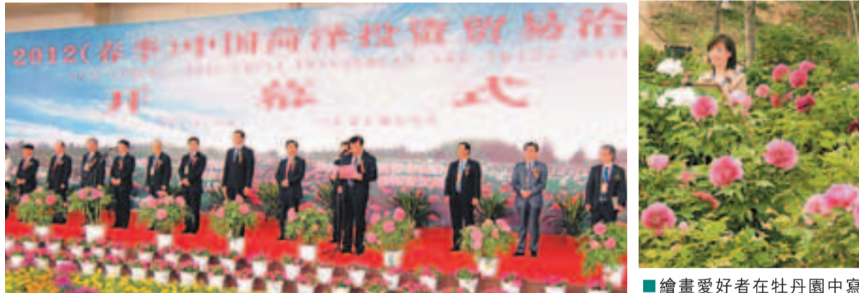
2012(春季)中國荷澤投資貿易洽談會開幕式。

香港文匯報訊(記者 何冉 荷澤報道) 2012荷澤國際牡丹花會正在山東荷澤舉行，上千個品種的各色牡丹競相開放供遊人欣賞。