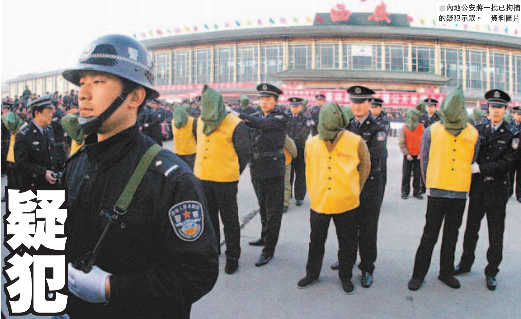
■內地公安將一批已拘捕的疑犯示眾。資料圖片

5. 有人說：「若一個國家或地區發生遊街示眾事件，該國或該地並非法治社會。」你對這個說法有何意見？