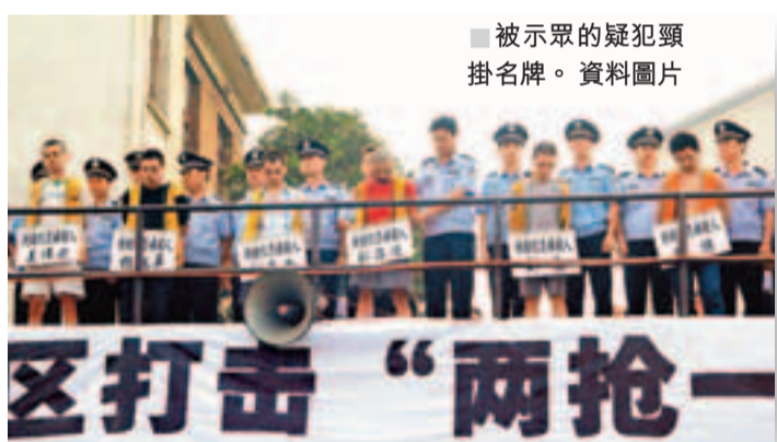
■被示眾的疑犯頸掛名牌。