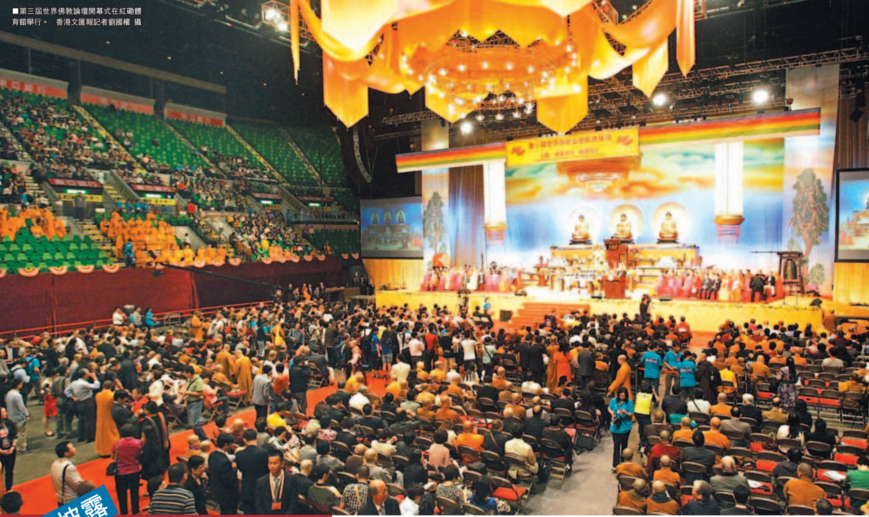
第三屆世界佛教論壇開幕式在紅磧體育館舉行。

與中華傳統文化，無疑是士農工商、男女老幼等同願同行對話的平台。所謂「聖人之治天下也，先文德而後武力」，可見人文教化之重要性。