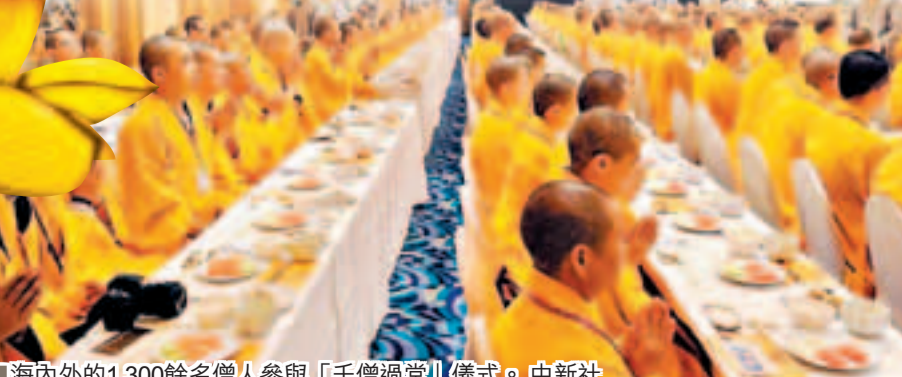
海內外的1,300餘名僧人參與「千僧過堂」儀式。

香港文匯報訊（記者沈清瀾）「三德六味，供佛及僧，法界有情，普同供養」，在維那師的引領下，逾1,300名僧人齊誦《供養咒》，在香港舉行的第三屆佛教論壇的重要活動之一「千僧過堂」隆重開始，展示了內觀自省、感恩惜福、知足常樂等傳統佛教理念，氣氛莊嚴，儀式謹嚴，場面盛大。