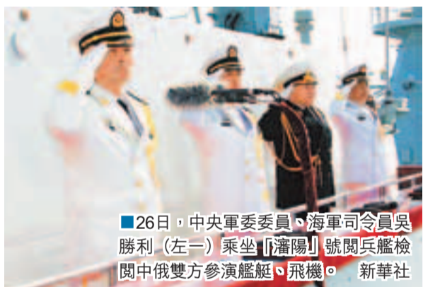
26日，中央軍委委員、海軍司令員吳勝利(左二)乘坐「瀋陽」號閱兵艦檢閱中俄雙方參演艦艇、飛機。

香港文匯報訊(記者 葛沖 綜合報道)中俄海上聯合軍演26日上午舉行了對海、對潛和對空實兵實彈演練，並進行了聯合護航、聯合反劫持演習。至此，中俄海上聯合軍演所有科目全部圓滿完成。當天下午，中俄艦艇和飛機還舉行了盛大的海上閱兵式。中國國防部發言人指，此次軍演取得三方面成果，演習增進了兩國戰略互信和協作水平，拓展了兩軍交流合作的領域，有效提高了雙方共同應對新挑戰、新威脅的能力。