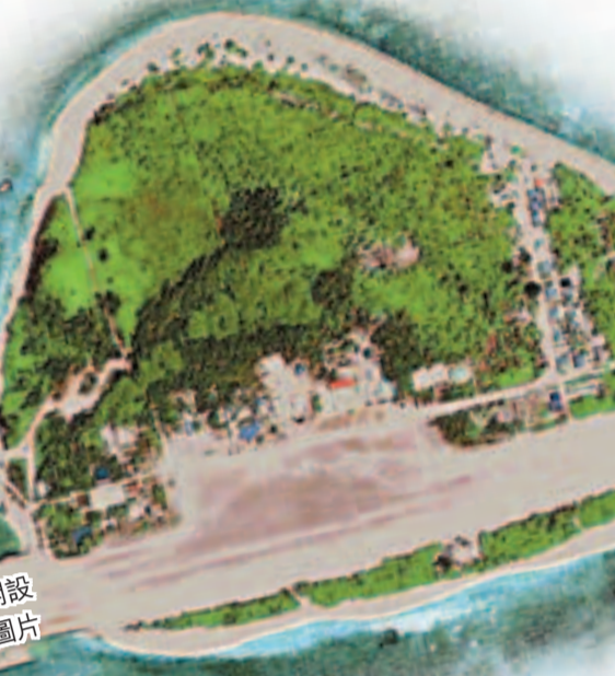
菲律賓將於本年6月在中業島上開設小學並建設小型碼頭。

香港文匯報訊(記者 葛沖 北京報道)在中菲持續在黃岩島對峙之際，菲律賓卡拉揚鎮的比特奧濃鎮長聲言，將於本年6月在與中國等國存在主權爭議、目前由菲方控制的「派格阿薩島」(中國稱中業島)上開設小學並建設小型碼頭。中國外交部昨日警告菲方不要再搞小動作，並強調中方反對任何國家侵犯中國主權的非法活動，呼籲菲方避免爭議複雜化和擴大化。而中國國家海洋局昨日宣布，同意海南省在西沙、南沙填海建碼頭。