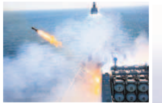
中俄舉行了對海、對潛和對空實彈演練，圖為中俄艦艇編隊實施火箭深彈射擊。