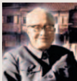
■晚年時期的沈從文。