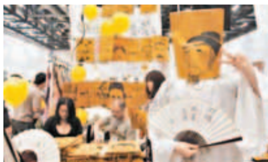
■北京第七屆「囡囡有神同人動漫展」，動漫愛好者推出「杜甫很忙」主題紙袋頭套。

當「杜甫很忙」成功地從課本走向網絡，引發對傳統文化和名人形象保護的爭議，又從網絡走向現實，啟發了營銷領域的商機。諸多遊戲、商品、活動，都加入了有「杜甫很忙」形象的宣傳。網絡遊戲《仙域風雲》的負責人甚至表示，願以部分運營