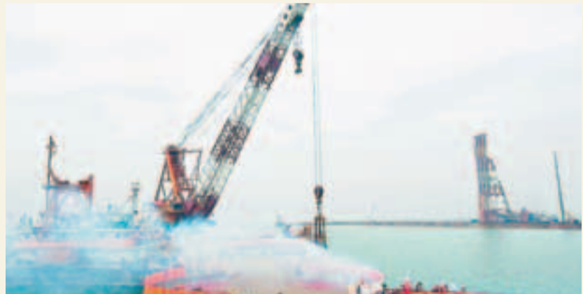
大橋因環評訴訟而耽誤開工，造成工期吃緊造價急升的惡果。圖為珠海段由於及時間開工，人工島主體已竣工。