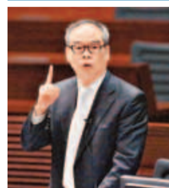
劉江華批評公民黨策動司法覆核後，使香港接線工程造價急升88.6億元。香港文匯報記者黃偉邦攝