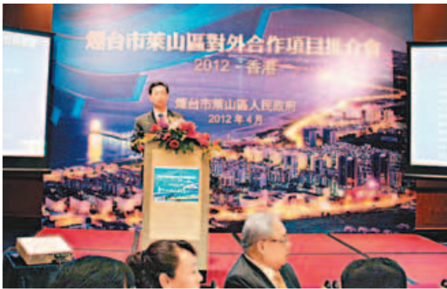
煙台市萊山區在港舉行對外合作項目推介會,會上推介九大項目,涵蓋旅遊地產、核電開發、葡萄酒莊等產業。

香港文匯報訊(記者 于永傑)山東煙台市萊山區昨日在港舉行對外合作項目推介會,會上共推介了煙台總部經濟基地、煙台(萊山)新型生態產業園、煙台(萊山)核電產學研聚集區、煙台植物園綜合開發項目等9個項目,涉及旅遊地產、核電開發、葡萄酒莊等產業。其中萊山核電產學研聚集區項目計劃總投資100億元,分為裝備製造區、研發服務區和生活配套區。建成後將成為山東省最大的核電產業園區之一,涵蓋核電、航空航天、海上鑽井平台等多個領域。