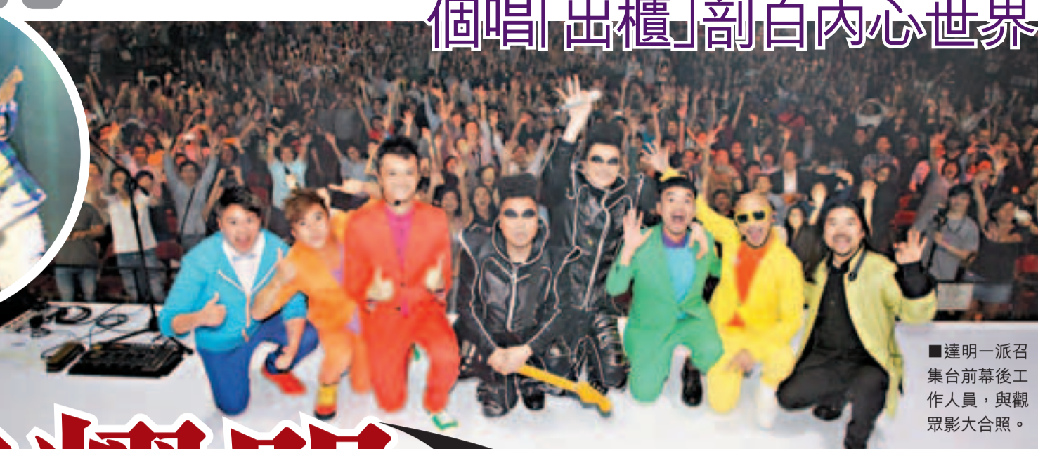
達明一派召集台前幕後工作人員，與觀眾影大合照。