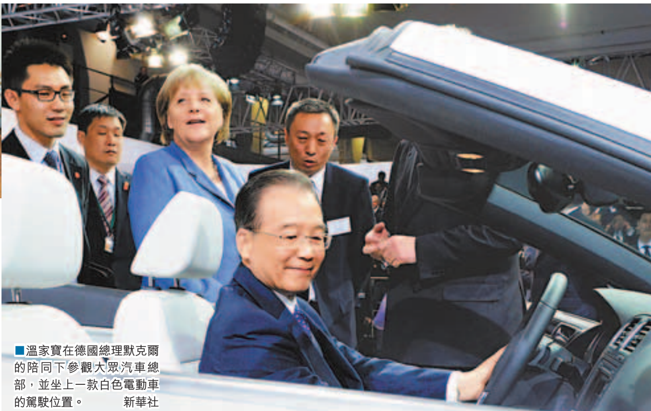
溫家寶在德國總理默克爾的陪同下參觀大眾汽車總部,並坐上一款白色電動車的駕駛位置。

溫家寶將與瑞典首相費爾特一同出席簽署儀式。據報在富豪汽車的交易中,該車廠將與中國開發銀行達成協議,後者會協助富豪落實一項直至2015年、涉款達750億瑞典克朗(約862.7億港元)的投資項目。