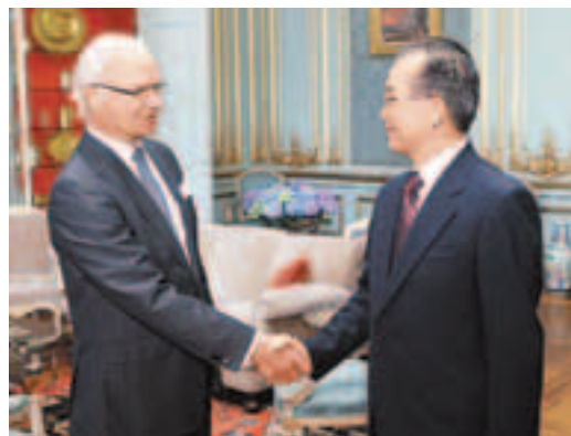
溫家寶會見瑞典國王古斯塔夫。新華社

香港文匯報訊 據中新網報導,在結束德國行程後,中國總理溫家寶乘坐的專機於當地時間23日下午5時許飛抵瑞典哥德堡蘭德維特機場。這是溫家寶此次歐洲四國之行的第三站,也是中國總理28年來首次訪問瑞典。