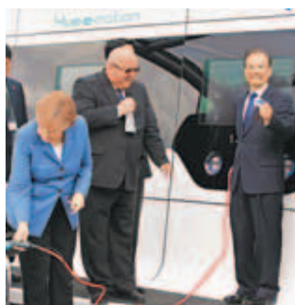
兩位總理演示電動車充電過程。

「我在這裡看到了中德合作又一個成功範例。」放下充電器後,默克爾首先說道。目前,大眾公司與中方的合作規模不斷擴大,並計劃在中國西北投資設廠,積極參與中國中西部開發,這將為大眾自身發展帶來新的機遇。兩國要在擴大貿易、投資合作的基礎上,大力加強共同研發,不斷提升合作水平。「德