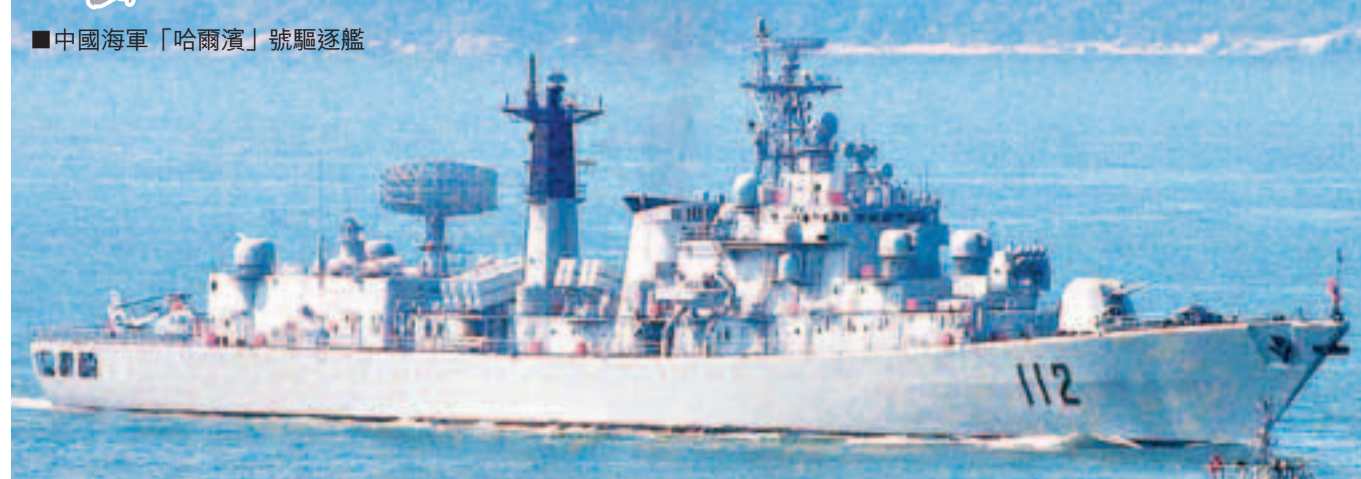
■中國海軍「哈爾濱」號驅逐艦