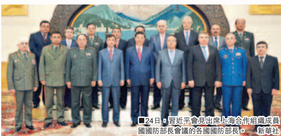
■24日，習近平會見出席上海合作組織成員國防部長會議的各國國防部長。

今年是上合組織第二個10年的起始之年，因此加強各成員國之間的防務安全合作具有重要的戰略意義。