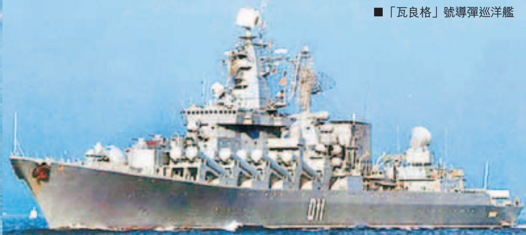
■「瓦良格」號導彈巡洋艦