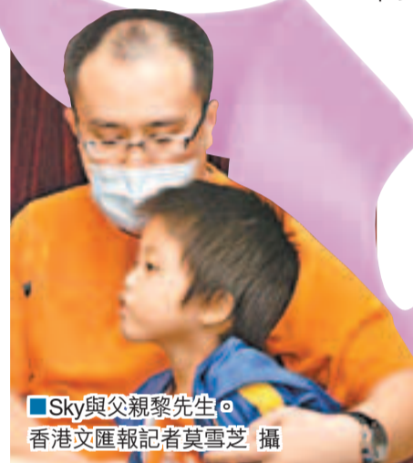
Sky與父親黎先生。

瑪麗醫院肝臟移植中心主管盧龍茂表示，本年器官捐贈情況是近年新低，單以心臟為例，本年截至上月只有1宗心臟捐贈個案，數字較10年前更低，呼籲市民支持死後器官捐贈。另外，亦有不少人在等待器官捐贈期間死去，以肝臟為例，去年共有115名病人等候換肝，當中有27人在等待期間去世，即5名病人即有1名等不及換肝便離世。伊利沙伯醫院腎科主管周嘉歡表示，去年遺體捐腎的只有59宗，連同活體捐腎總數亦不夠70宗，但等候換腎的有1,800人，最長的等了27年仍未等到。