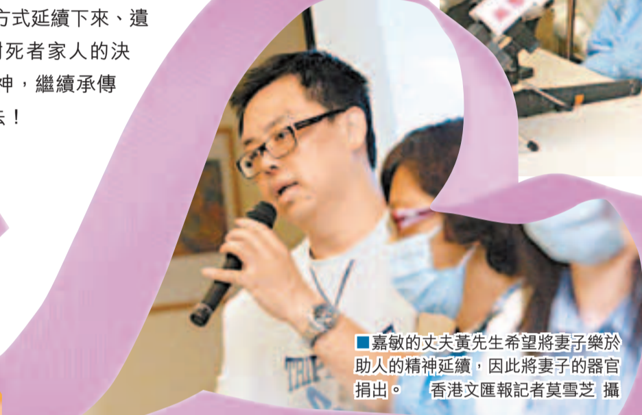
嘉敏的丈夫黃先生希望將妻子樂於助人的精神延續，因此將妻子的器官捐出。