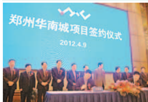
■鄭州華南城項目簽約儀式現場。

省長趙建才、鄭州市人民政府市長馬懿、新鄭市市長王廣國、華南城控股有限公司聯席主席兼執行董事鄭松興等人出席簽約儀式。