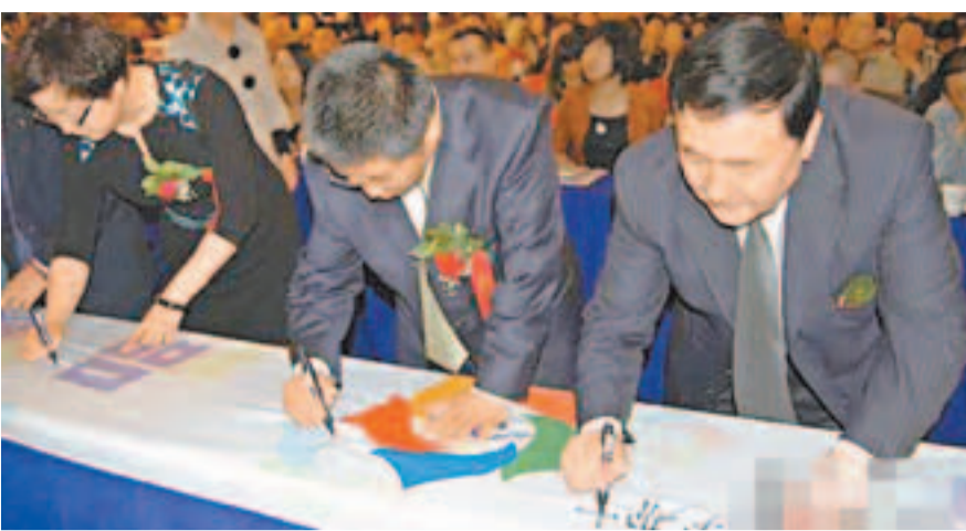
■新疆五大景區舉辦懇談會，與會領導在議場簽署。

新疆喀納斯景區在2012年堅持「環保優先、生態立區」，按照「國際視野，世界精品」的要求，先後被評為「全國低碳旅遊示範區」、「2011最具人氣旅遊目的地」以及新疆首家國家級「刷卡無障礙景區」。喀納斯國家地質公園被土資源部命名為國土資源科普基地，喀納斯冰雪風情旅遊節被評為中國「最具特色民族節慶」禾木哈納斯蒙古民族鄉被評為「新疆滑雪之鄉」，禾木村被評為「中國十大最有魅力休閒鄉村」。