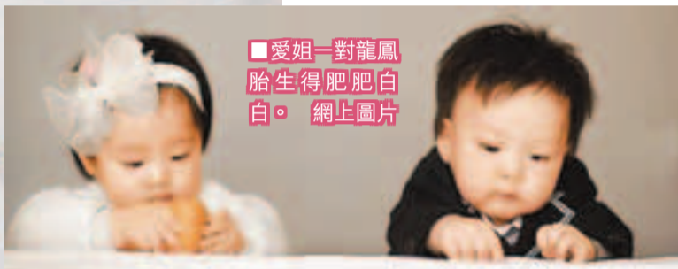
■愛姐一對龍鳳胎生得肥肥白白。