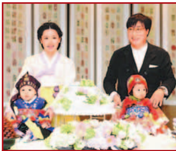
■愛姐今年2月曾向傳媒發放兒女的周歲照。