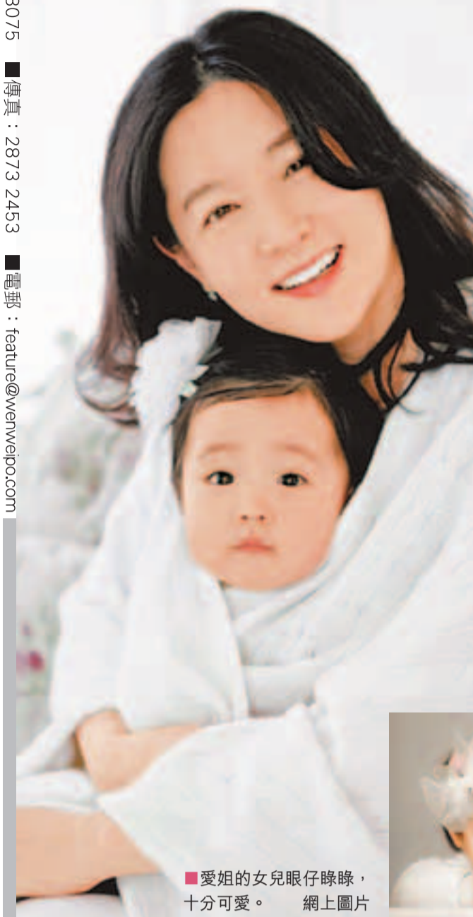
■愛姐的女兒眼仔碌碌，十分可愛。網上圖片

韓國女星「大長今」李英愛日前接受女性雜誌專訪時，罕有地攜同一對龍鳳胎亮相，她透露，因想多參與兒女們的成長，暫時還不會考慮復出，又大讚丈夫鄭浩英有責任心，如果有下世，仍盼與他共譜戀曲，但就希望早點結緣，以便留下更多美好的回憶。