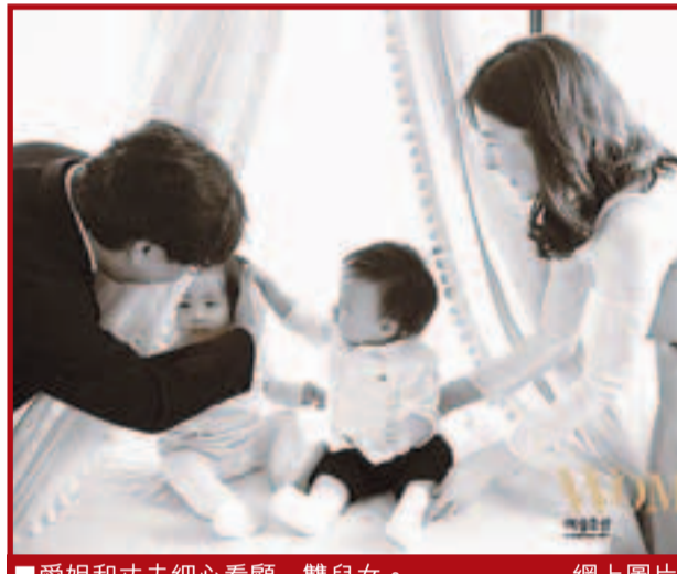
■愛姐和丈夫細心看顧一雙兒女。網上圖片