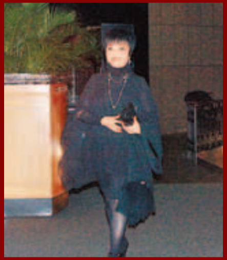
梅雪詩代答仙姐生日願望是身體健康。