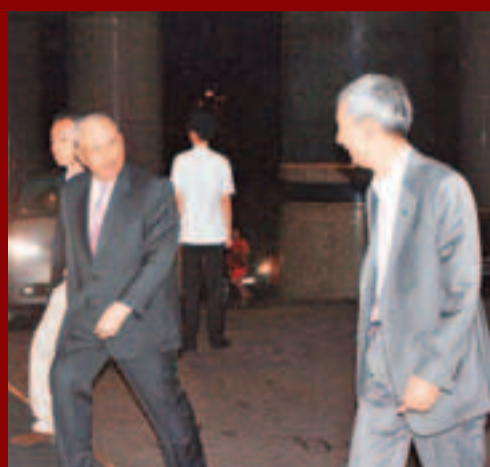
全國政協副主席董建華亦有現身酒店，未知是否有其他聚會。