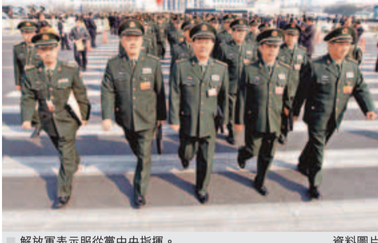
解放軍表示服從黨中央指揮。資料圖片