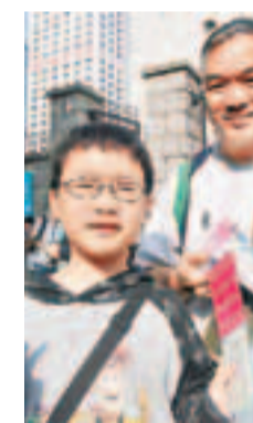
黃先生指港國民教育不足,期望兒子參觀軍營後另有體會。