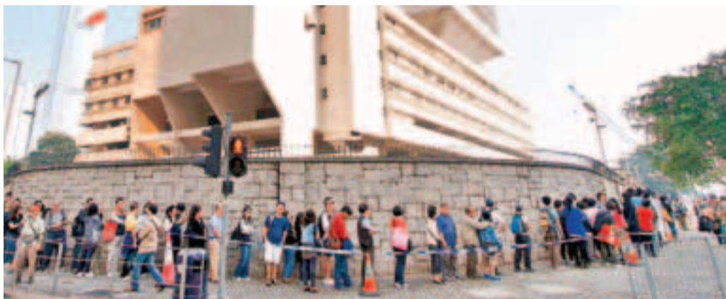
昨晨8時派發門券前,中環軍營門外已有大批市民扶老攜幼「打蛇餅」輪候。警方估計,最高峰時期約有400人排隊。