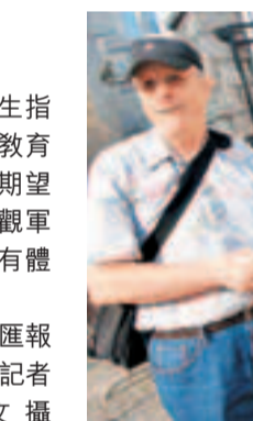
外籍人士亦前來領取門券。 香港文匯報記者彭子文攝