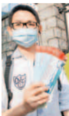
排頭位鄭先生打算到昂船洲軍營一睹中國先進軍艦。