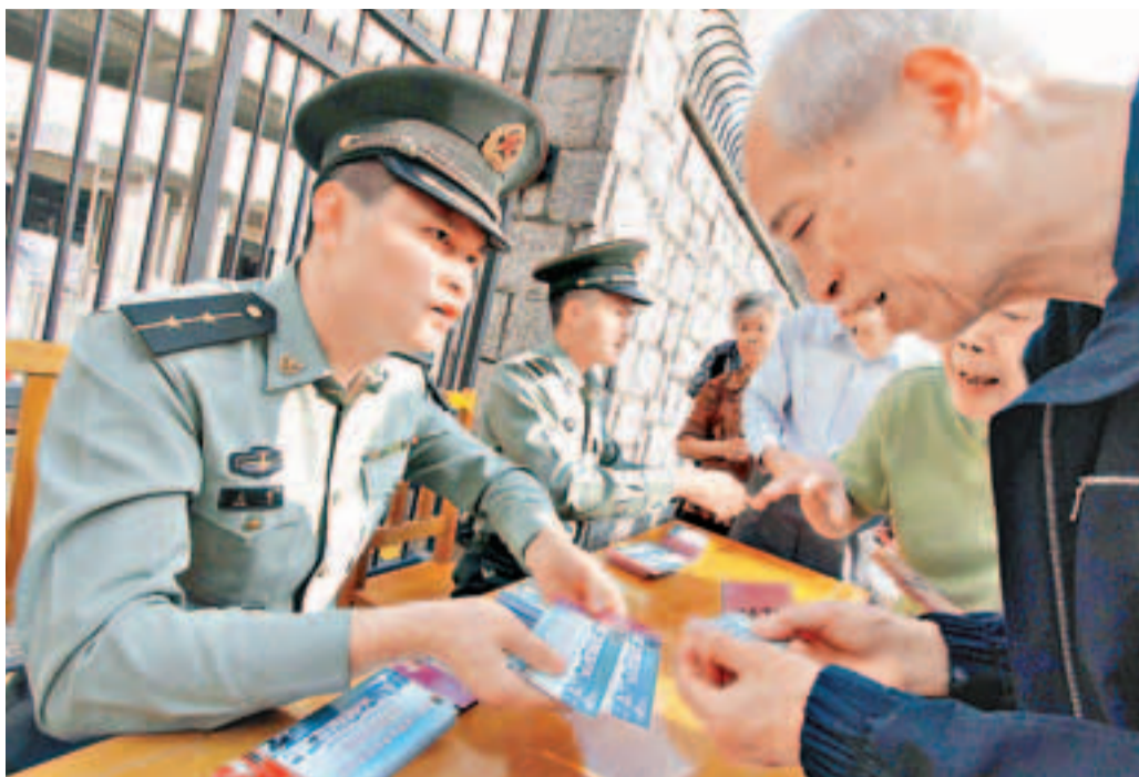
解放軍人員耐心向長者講解軍營開放情況,贏得市民讚賞。

在三大軍營中,以昂船洲軍營的門券最受歡迎。原來,剛完成護航任務的中國人民解放軍海軍171護航編隊的導彈驅逐艦「海口號」及導彈護衛艦「運城號」將於4月30日至5月4日停靠香港昂船洲軍營碼頭,並開放予市民參觀。消息一出,不少市民以為是次開放日只要進入昂船洲軍營,就可以一睹兩艘軍艦的風采。但據悉,兩艘軍艦開放參觀將另有安排,駐軍稍後會公布詳情。