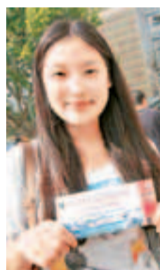
從河北來港讀書的閻小姐表示,有朋友當兵,認為他們很了不起。