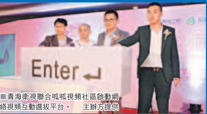
■青海衛視聯合呱呱視頻社區啟動網絡視頻互動選拔平台。

香港文匯報訊（記者 于永傑）青海衛視音樂選秀節目《花兒朵朵》，成為內地限娛令後首個拿到廣電總局批文的同類節目。近日，青海衛視聯合呱呱視頻社區啟動網絡視頻互動選拔平台，以承擔本屆《花兒朵朵》大賽所有的網絡互動海選環節，並成立了呱呱專場唱區。本次網絡海選面向全國18歲以上女生，將產生300名選手進入晉級賽，再經多輪PK角逐出12強，她們將進入訓練營接受專業培訓，並最終以大型落地演唱會的形式來決定4強的誕生，同時呱呱4強直接晉級花兒朵朵突圍賽。賽後這4強將奔赴長沙，繼續為着夢想奮力拼搏。