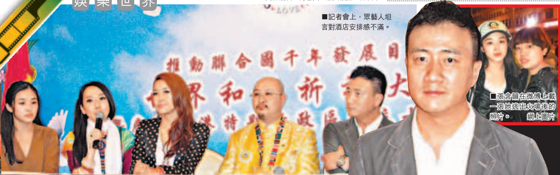
■記者會上，眾藝人坦言對酒店安排感不滿。