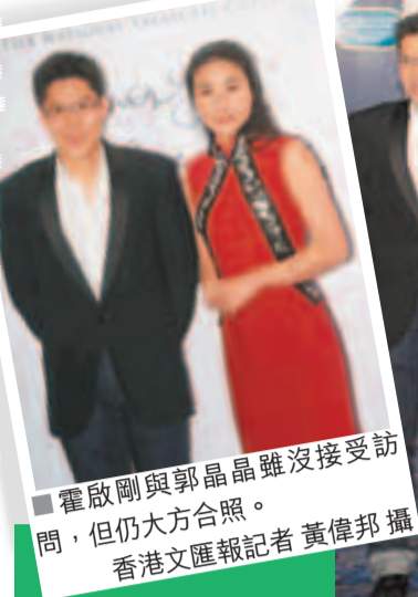
霍啟剛與郭晶晶雖沒接受訪問，但仍大方合照。