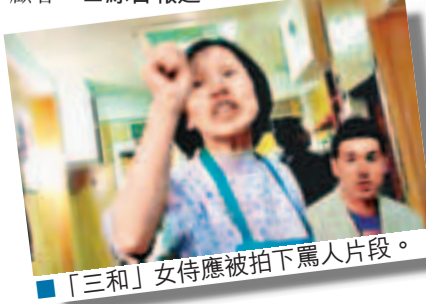
「三和」女侍應被拍下罵人片段。

當局表示,「三和」持續衛生未達標,但強調並非要「三和」永久關門,只要有改善,當局十分支持其繼續服務顧客。■綜合報道