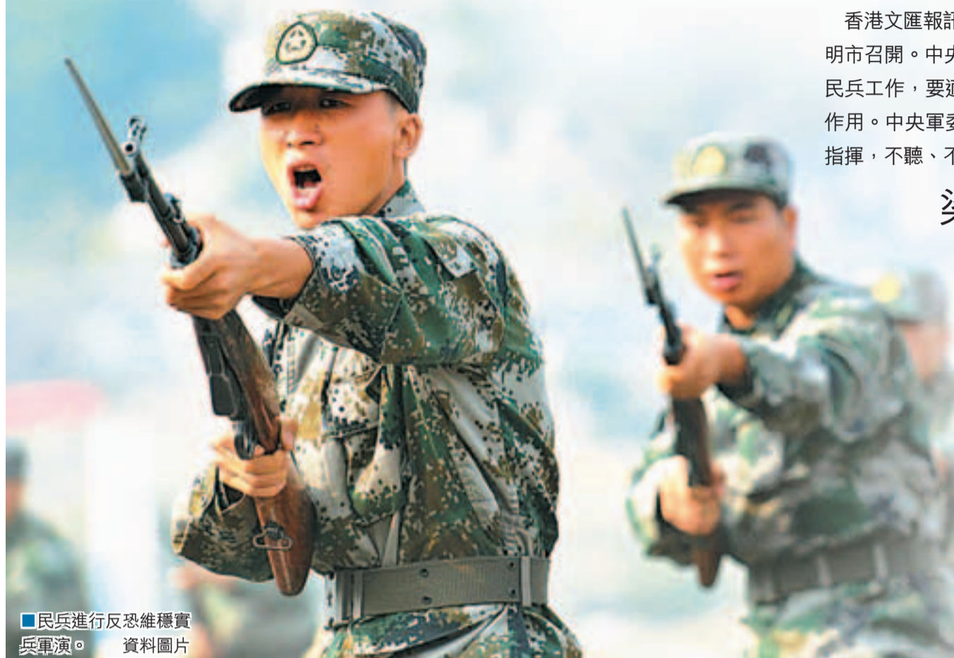
民兵進行反恐維穩實兵演。資料圖片

要更加注重維護社會大局穩定和保持部隊自身安全穩定，進一步增強政治意識、大局意識、憂患意識和責任意識，積極協助地方做好維護社會穩定的工作以及隨時應對可能出現的重大自然災害等突發情況的準備，確保一聲令下能夠迅速出動，堅決完成任務。