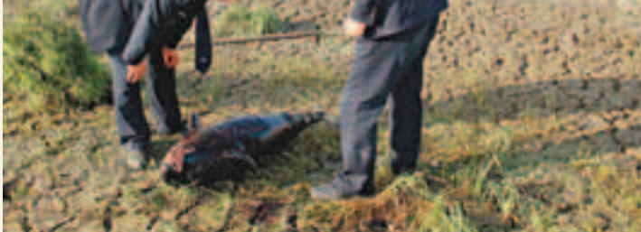
鄱陽湖江西都昌水域，漁政人員在檢查一頭已死亡的江豚。

香港文匯報訊 繼湖南洞庭湖10多頭江豚死亡震驚世人後，近日，認為是長江江豚最後自然棲息地的江西鄱陽湖又被曝江豚大量死亡事件。據《長江日報》報道，中科院水生所專家稱，今年2月以來，鄱陽湖死亡江豚數量超過20頭。與此同時，本港沙灘今年以來發現的死亡江豚也超過15頭，4月6日以來更錄得7頭江豚屍體。連續傳來的兇訊令人揪心：江豚這一「水中大熊貓」是否會快速步白鱘後塵，最終滅絕？