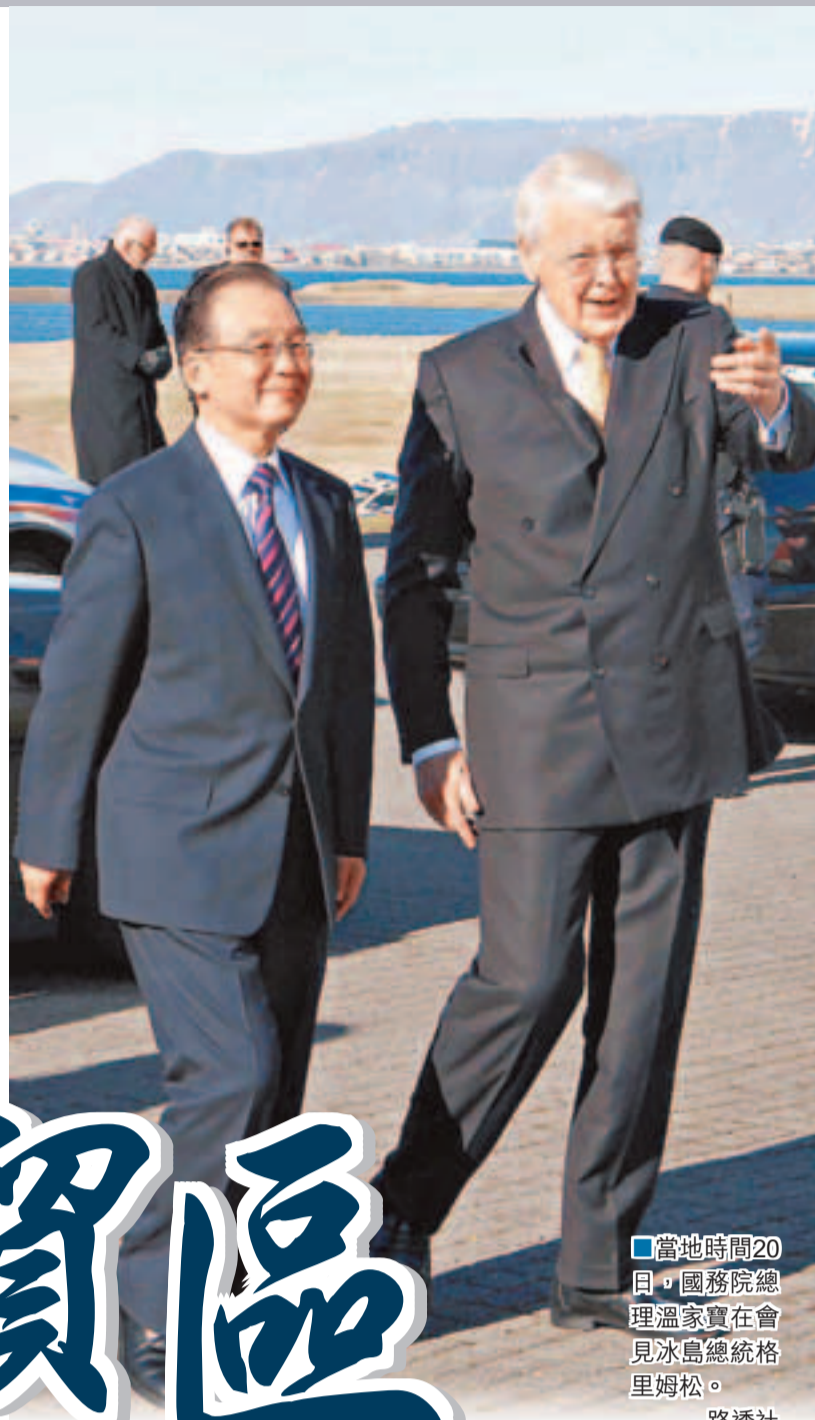
當地時間20日，國務院總理溫家寶在會見冰島總統格里姆松。