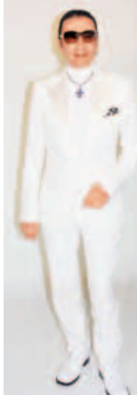
身形不爆的四哥稱早預備了8套服裝來拍攝今次廣告。