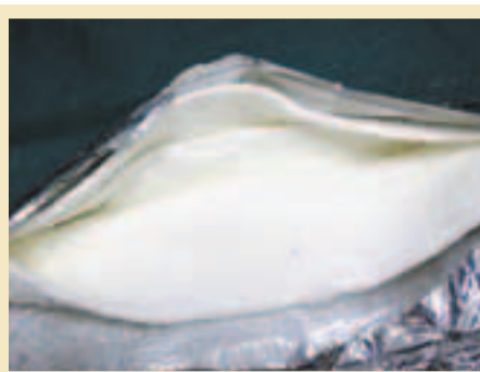
滲有可卡因的夾棉。