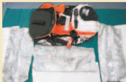
滲有可卡因粉末的棉花，以錫紙掩飾藏於行李袋暗格。