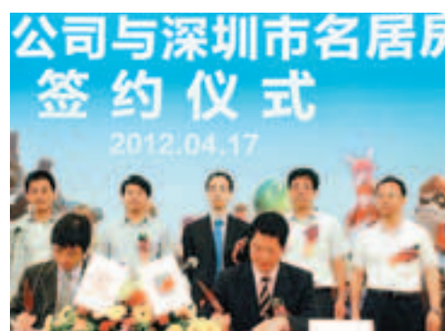
「華夏動漫樂園」簽約儀式現場。

「華夏動漫樂園」是由華夏動漫集團引進海外最時尚、最先進、最好玩的大型室內動漫樂園,設備具有海外成熟的技術基礎,安全性也是全球領先,項目佔地面積10萬平方米,總建築面積48萬平方米,「華夏動漫樂園」室內建築面積3萬平方米,首期投資人民幣45億元。主要包括有星屋互動遊戲、汽車賽車、漂流、4D影院、滑雪機、小型過山車、遊戲機等最流行的動漫遊戲,堪稱是最好玩的室內動漫樂園。